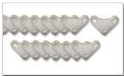
コーナープレート 16枚