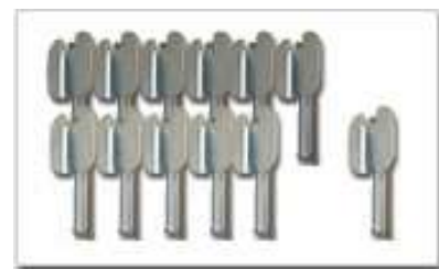
ワンタッチフック 12個 (※天地5段の場合)