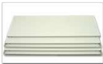
棚板 5枚 (※天地5段の場合)