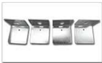
ベースキャップ 4個